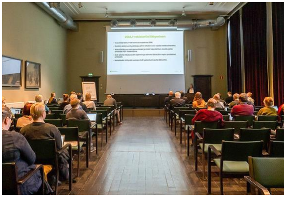
Tieteiden talon salissa joukko ihmisiä kuuntelemassa DOAJ-rekisteristä.