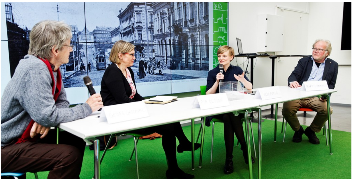
Lokakuussa 2019 Suomen Kaupunkitutkimuksen Seura oli TSV:n kuukauden jäsenseura.