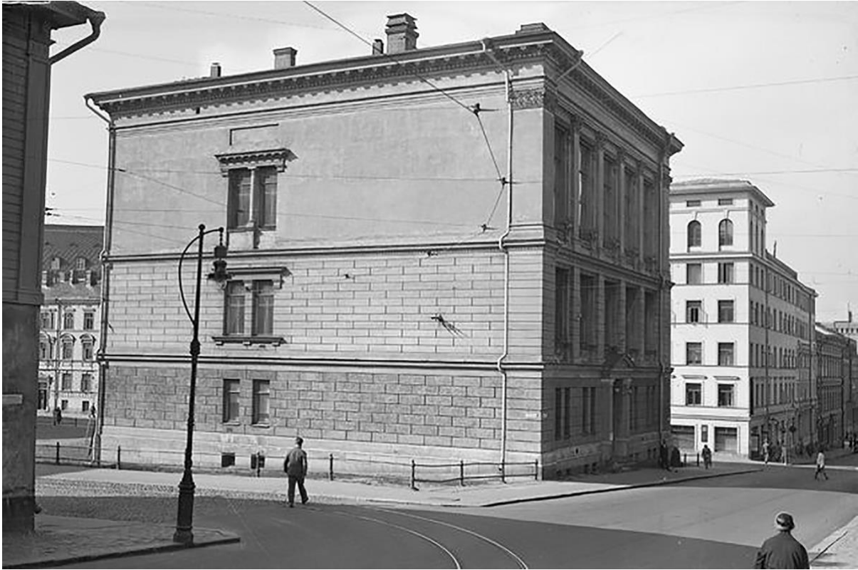
Tieteellisten seurain valtuuskunnan ensimmäiset toimitilat olivat Pöllön talolla, Kasarmikadulla vuosina 1899–1931.